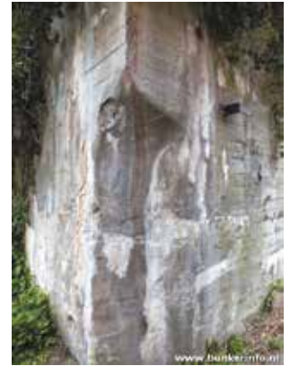
De voormalige bunker in de wijk Transvaal.