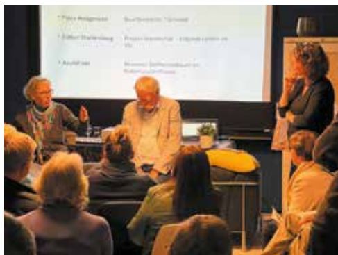
Overleg over het studieproject in de wijk

sloppen in de binnenstad, die begin twintigste eeuw werden gesloopt. Voortzetting van het straatleven uit deze sloppen werd mogelijk gemaakt in het lichte, groene en beschutte Transvaalhof. Bouwtechnisch is het hof geïnspireerd op de Amsterdamse School, wat vooral te zien is aan de ronde hoeken. “Ik woon in een monumentaal pand,” constateert een van de bewoners dan ook.