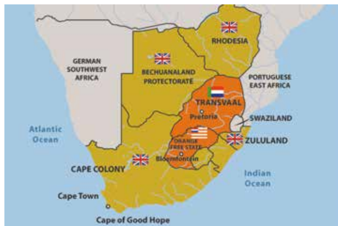
De voormalige provincie Transvaal in Zuid-Afrika.